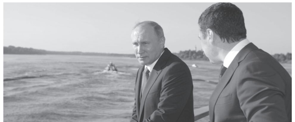
На борту теплохода «Россия»