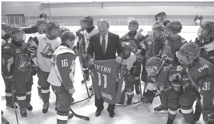
Юные хоккеисты подарили президенту свитер «Локомотива»