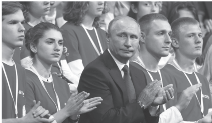
На всероссийском форуме «ПроеКТОрия»

Открытый урок «Россия, устремлённая в будущее» глава государства начал с поздравления с Днём знаний.